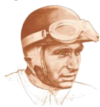
Juan Manuel Fangio

Día Nacional del Automovilismo Deportivo en homenaje al único quíntuple Campeón Mundial de Fórmula Uno Internacional, Juan Manuel Fangio, en el aniversario de su muerte.